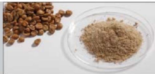
Café crudo antes y después de la molienda con un anillo de tamiz P-14 de una perforación trapezoidal de 1 mm a 20,000 rpm.