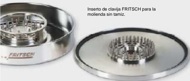
Inserto de clavija FRITSCH para la molienda sin tamiz.

Otra sugerencia: durante la molienda de las muestras sensibles a la temperatura, el kit de conversión para la molienda de grandes cantidades con su bolsa de soporte de nilón asegura un alto rendimiento de aire, obteniendo incluso un mejor enfriamiento.