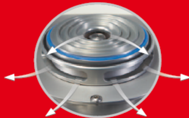
Trayectoria de aire para un enfriamiento eficaz de la muestra.

Disponibles sólo para FRITSCH: la ingeniosa trayectoria de aire del modelo PULVERISETTE 14 asegura un flujo de aire constante para enfriar el rotor, todos los componentes del motor y el material de molienda en el recipiente colector. Al mismo tiempo, un ventilador sopla el aire de enfriamiento dentro del aparato a través de un filtro de partículas de espuma para crear una presión positiva que evita la penetración de las partículas contaminantes al aire ambiente.