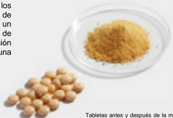
Tabletas antes y después de la molienda en el PULVERISETTE 14 con la barra de impacto y el anillo de tamiz con una perforación trapezoidal de 2 mm a 20,000 rpm

Para la preparación muestra de acuerdo con la RoHS, como para la verificación del cromo hexavalente, equipe su PULVERISETTE 14 con un rotor de 12 costillas recubiertos de carburo tungsteno y un anillo de tamiz recubiertos con carburo de tungsteno con perforación trapezoidal.